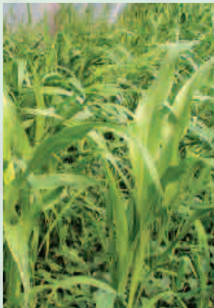
Le sorgho fourrager est l'engrais vert de référence sous abri l'été

Elle est déterminante pour la réussite d'un engrais vert. Ainsi pour un engrais vert d'automne, on sèmera les Légumineuses,