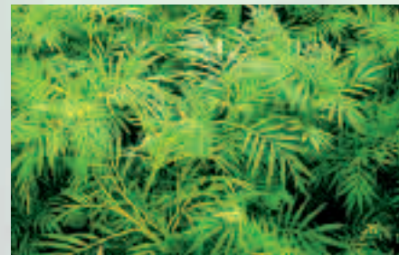
Les tagetes minuta ont des propriétés nématocides vis-à-vis de Meloidogyne