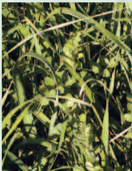
Les mélanges de Graminées et Légumineuses (ici RGI + vesce) sont intéressants à introduire dans les rotations de légumineuses

L'engrais vert est l'occasion d'introduire des espèces différentes de celles couramment cultivées sur l'exploitation, pour