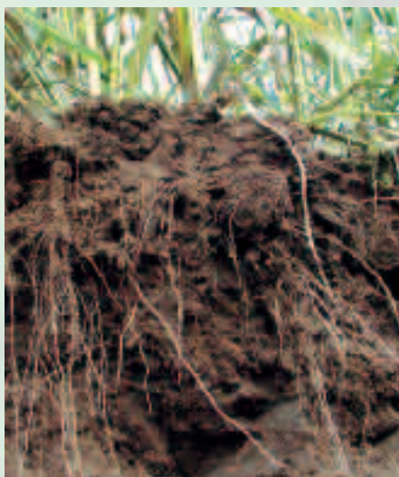
Le système racinaire des Graminées fourragères est un des plus efficace pour fissurer le sol

L'abondance de nourriture fermentescible stimule aussi l'activité microbienne. La dégradation de cet apport de matière organique libère des produits transitoires qui sont particulièrement actifs sur la stabilité structurale par leurs propriétés agrégeantes. L'effet sur la stabilité structurale est fugace mais néanmoins intense. La rapidité de décomposition dépend notamment du rapport C/N, qui est plus faible pour les couverts pauvres en lignine et cellulose et/ou riches en azote (Crucifères, Légumineuses, couverts jeunes peu lignifiés).