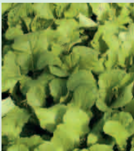
Les Crucifères, en se développant rapidement, assurent une protection efficace de la surface du sol

• Après destruction de l'engrais vert , l'incorporation d'une grande quantité de biomasse fraîche stimule l'activité biologique. Les vers de terre, qui se nourrissent des débris végétaux, prolifèrent. En creusant des galeries, ils augmentent la porosité du sol et facilitent ainsi le resuyage et l'aération.